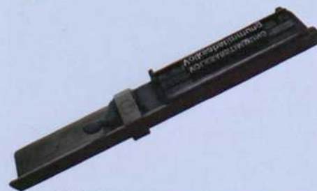
Winkelhaken mit Keilhebelverschluss