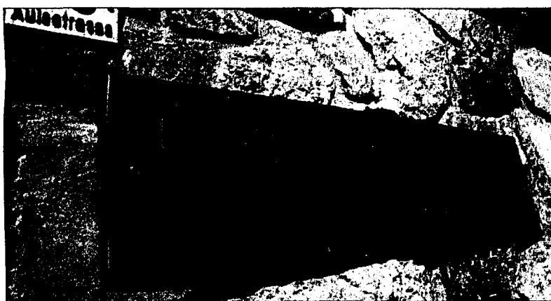
Zwei junge Frauen müssen sich wegen gegenseitiger Handgreiflichkeiten vor Gericht verantworten.

Dreimal gerieten die beiden jungen Frauen am besagten Abend aneinander. Dabei brach sich die zweite Angeklagte den Unterkiefer, die Erstangeklagte kam mit einer Beule und einer Rötung der Kopfhaut davon. Über den Tathergang sind sich die Angeklagten gar nicht einig: Ihre Aussagen gehen weit auseinander. Beide behaupten, die jeweils andere habe sie beschimpft und geschlagen. Die zwei Angeklagten bestehen darauf, dass sie