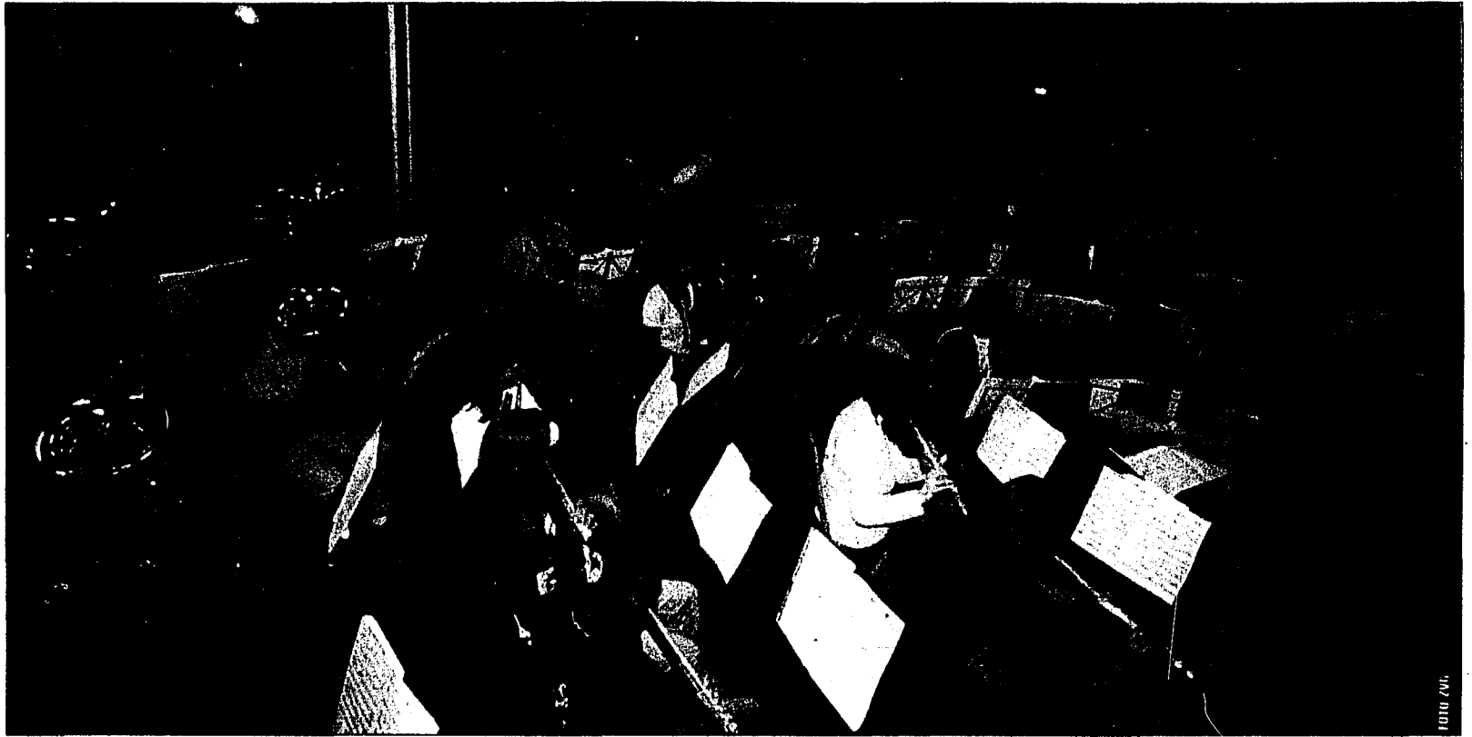
Die Mitglieder der Harmoniemusik Schaan haben sich für ihr Passivkonzert – wie für jeden ihrer Auftritte – im Proberaum mächtig ins Zeug gelegt.

Passivkonzert der Harmoniemusik Schaan im Rathaussaal