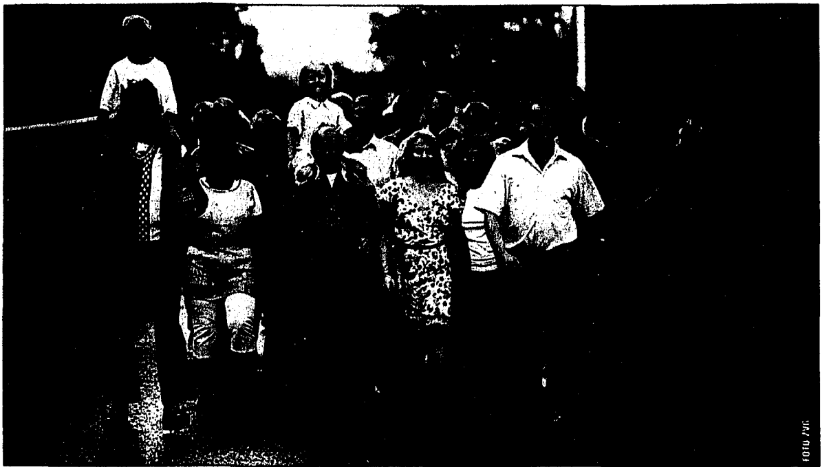
«As It is in heaven» ist von heute Donnerstag um 20 Uhr sowie am Samstag und Sonntag jeweils um 18 Uhr im Takino zu sehen.

Das merkt man dem Film an. Jedes Wort, jedes Bild stimmt. Durch die Zusammenarbeit mit Komponist Stefan Nilsson ist der Film auch musikalisch ein Meisterstück. «As it is in heaven» ist von heute Donnerstag um 20 Uhr sowie am Samstag und Sonntag jeweils um 18 Uhr im Takino zu sehen.