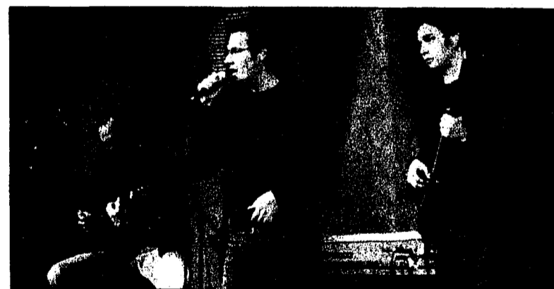
Ihre Musik begeisterte: «Nevertheless» und die «Gschgger Sennapeppa».