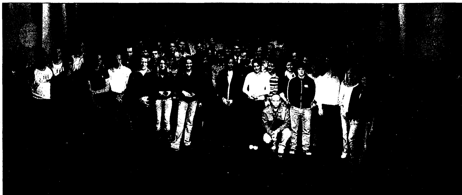
Ein imposantes Gruppenbild: Die Liechtensteiner Landesmeisterinnen und Landesmeister 2005 mit ihren Meistropyramiden auf einen Blick.