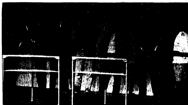
Moderator-Lehrling «Biederman» im Interview mit Liechtensteins EM- und WM-Medallengewinnern 2005.