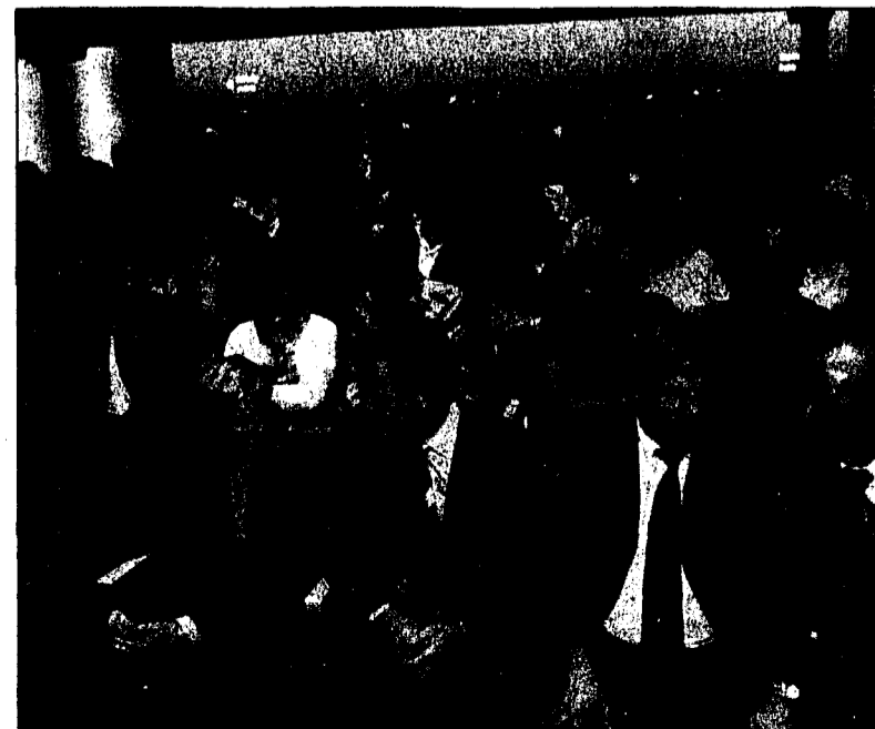
Volles Haus im neuen TaK. Der «Sportlertreff» war erneut ein Riesenerfolg.