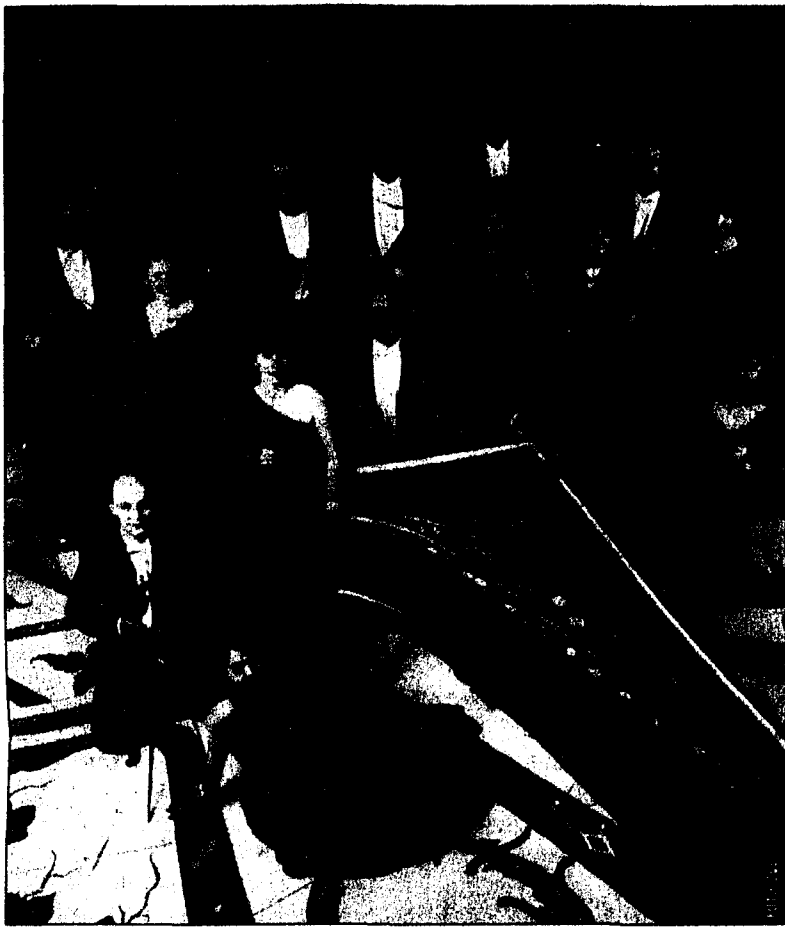
Zum Nachmittagskonzert am 4. Advent bittet die Akademie für Alte Musik in die Pfarrkirche Schaan.