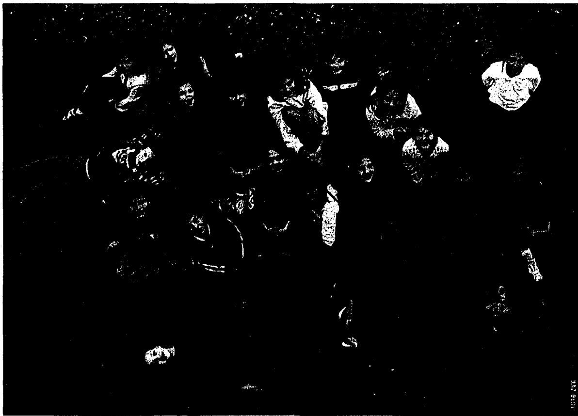
Der U13-Spielclub zeigt sein selbst erarbeitetes Theaterstück am 17. Dezember um 16 Uhr im TaKino.

Das mit der Regisseurin Franziska Schnetzler und Georg Biedermann erarbeitete Theaterstück dauert rund 60 Minuten, es ist für Zuschauer ab 6 Jahren geeignet. Die Vorstellung ist der