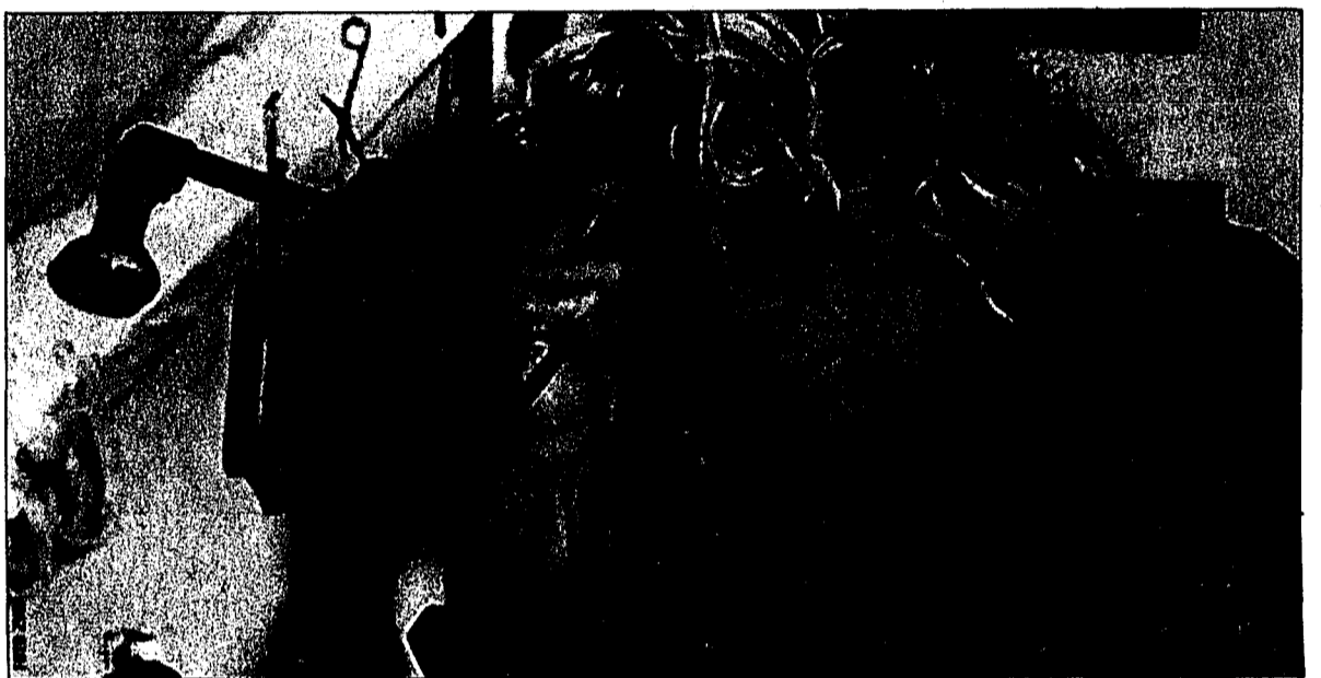
Der deutsche Zeichner Dichter und Dramatiker F. K. Waechter (1937–2005), Meister skurriler Hintergründigkeiten.

Es heisst, dass der Teufel sich mit seiner Grossmutter in der cumberlandischen Galerie eingenistet hat. In dem alten Gemäuer ist ein unheimliches Klabastern und Rumoren zu hören, und tatsächlich werbelt da ein Geselle im Hausmeisterkittel herum und sorgt dafür, dass es bis unters Dach schabt, klopft, wispert, scheppert und dröhnt. Plötzlich das Knarren der Tür, Stimmengemurmel, Lachen, Gezänk. In der Gestalt einer Putzfrau erscheint des Teufels Grossmutter und erzählt, erspielt und durchlebt in verschiedenen Rollen die Geschichte des Königs von Sizilien, der heiss aber hoffnungslos die schöne kühle Eisprinzessin liebt. Drei Jahre muss er bei der Grossmutter des Teufels in die Lehre gehen, dann macht er sich, als Mädchen verkleidet, erneut auf dem