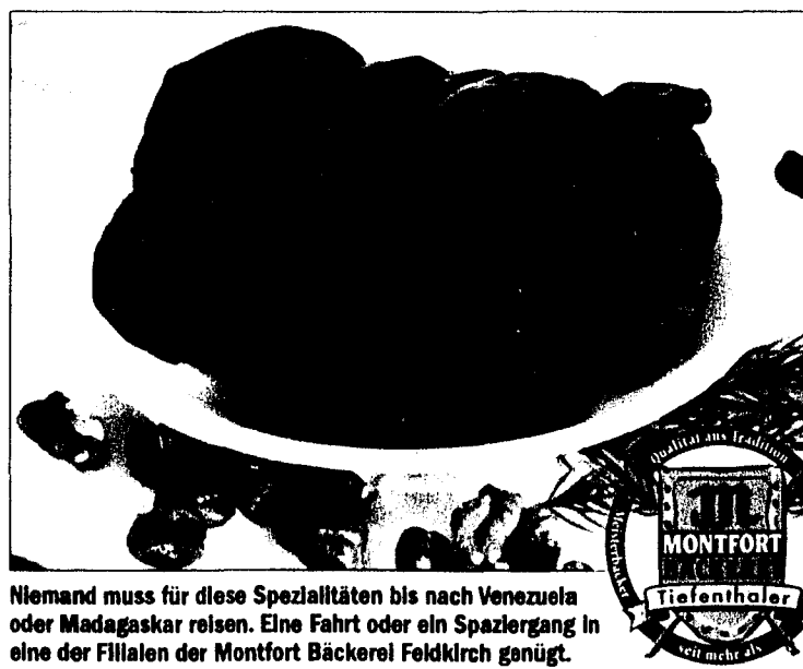
Niemand muss für diese Spezialitäten bis nach Venezuela oder Madagaskar reisen. Eine Fahrt oder ein Spaziergang in eine der Filialen der Montfort Bäckerei Feldkirch genügt.

Dann gibt's noch die berühmten Weihnachtskekse nach Großmutter Art, die – wie es sich gehört – in edlen Dosen verpackt sind, wo sie noch perfekt „nachreifen“ können. Eine weitere Spezialität ist das saftigste und leckerste Birnenbrot weit