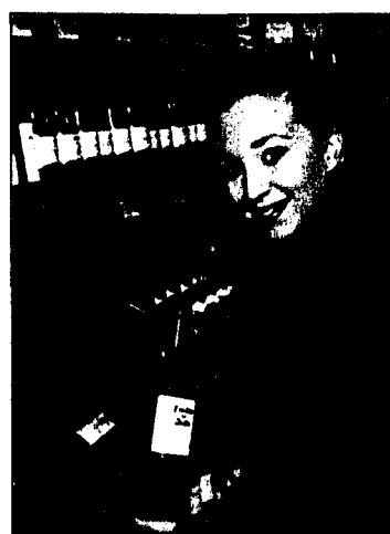
INTERSPAR bietet eine riesige Auswahl an erlesenen Weinspezialitäten.

Natürlich darf zu den Festtagen ein gepflegtes Glaserl Wein oder Schampus nicht fehlen. Auch als Geschenke sind derart edle Tropfen geradezu prädestiniert. Unser Tipp: Kommen Sie doch einfach in die riesige INTERSPAR-Weinwelt im INTERSPAR im ILLPARK! Ganz besondere Schnäppchen finden Sie im Weinwelt-Meter. Hier gibt es immer sensationel-