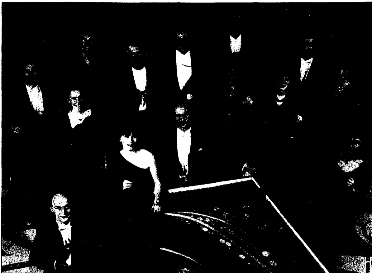
Zum Nachmittagskonzert am 4. Advent bittet die Akademie für Alte Musik in die Pfarrkirche Schaan.

Nachmittagskonzert in der Pfarrkirche St. Laurentius in Schaan