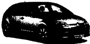
Citroën C4 Limousine 1.4i-16V X, 90 PS, 5 Türen Ab Fr. 19'490.-* Mispreis oder PRÄMIE bis Fr. 7'000.-