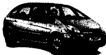
Citroën Xsara Picasso 1.6i X, 95 PS, 5 Türen Ab Fr. 17'790.-* Mispreis oder PRÄMIE bis Fr. 9'000.-