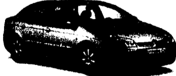
Citroën C6 Limousine 1.8i-16V X, 125 PS, 5 Türen Ab Fr. 28'990.-* Mispreis oder PRÄMIE bis Fr. 10'000.-