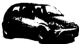
Neue Modellreihe Citroën C3 1.1i X, 60 PS, 5 Türen Ab Fr. 14'990.-* Mispreis oder PRÄMIE bis Fr. 5'000.-