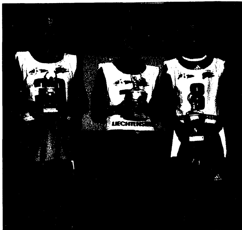
Die strahlenden Sieger des Talenttages des USV Eschen-Mauren.

Der 3. Fussball-Talenttag des USV fand bei allen Teilnehmern und den anwesenden Eltern grossen Anklang. Hagen Pöhnert vom Hauptsponsor LKW lobte den Anlass und sicherte auch für das