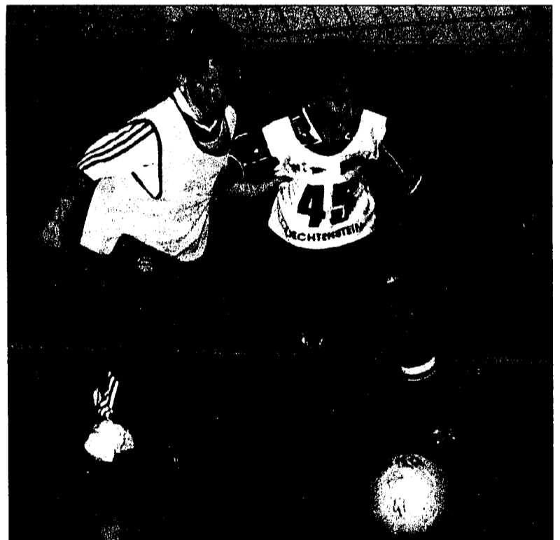
Der Nachwuchs ist beim 3. USV-Fussball-Talentetag wieder am Ball.

Die Finals und Demonstrationen finden ab ca. 16 Uhr statt. Zuschauer sind herzlich willkommen. (PD)