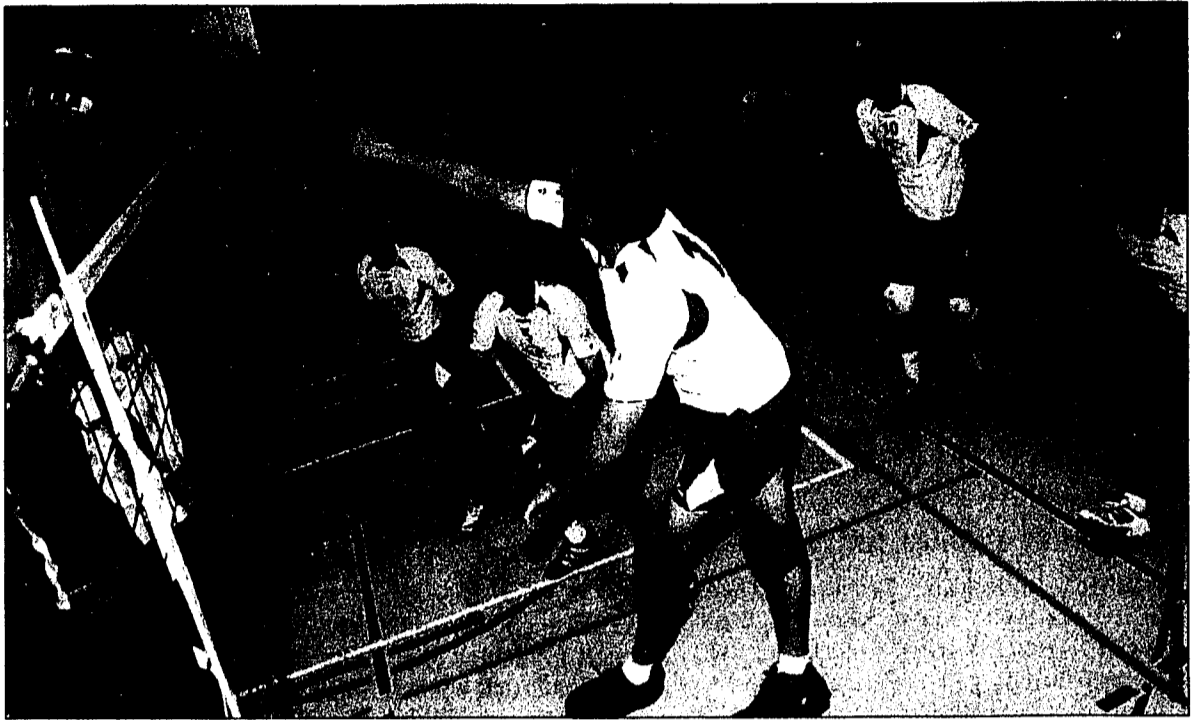
Spitzenspiel: Leader Galina Schaan ist heute auswärts gegen den Tabellenzweiten Chur gefordert.

SCHAAN – Trotz frostiger Temperaturen wartet auf Liechtensteins Volleyball-Cracks heute ein heisser Zweitliga-Tag. Die Herren von Galina Schaan bestreiten in Chur das Spitzenspiel und bei den Damen ist Derbytime angesagt. Mauren-Eschen empfängt Galina Schaan.