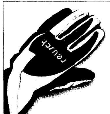
Love your sport – mit Handschuhen von Reusch.

«Peak Performance» steht für Perfektion und sportliche Höchstleistungen. Der skandinavische Bekleidungshersteller ist eine der führenden Marken im Sport- und Outdoorbereich und einer der Hauptbrands bei Brogle Intersport.