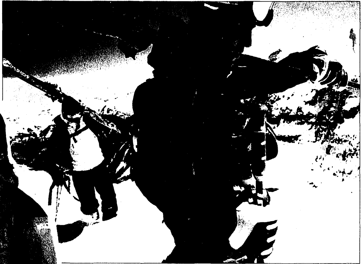
Kombination aus Funktionalität und Fashion. Wer den Winter erleben will, ist mit Skibekleidung von Peak Performance gut bedient.

Während bis anhin nur Extrem-Skifahrer höchste Ansprüche an ihre Bekleidung gestellt haben, achtet mittlerweile auch der Hobby-Skifahrer verstärkt auf funk-