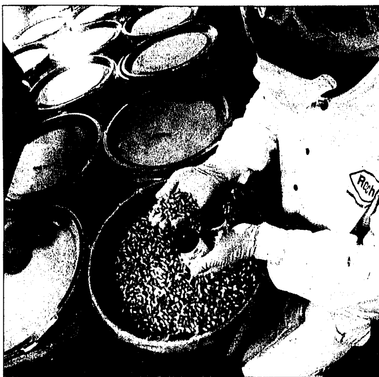
In Japan sind gemäss jüngsten Berichten bereits 13 Kinder gestorben, die das Grippemittel Tamiflu eingenommen haben.

Swissmedic weist darauf hin, dass in der Schweiz bisher keine Todesfälle oder Suizidversuche wegen Tamiflu gemeldet wurden.