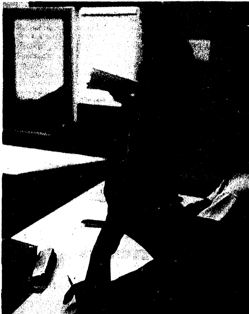
Vielen Migranten und Migrantinnen, die in Sprachkursen in der Schweiz Deutsch lernen, fällt der Einstieg in das Berufsleben einfacher.

Das Lesebuch vereinigt 12 Porträts von Migrantinnen und Migranten, die seit einiger Zeit in der Schweiz leben und über ihre Herkunft und ihren