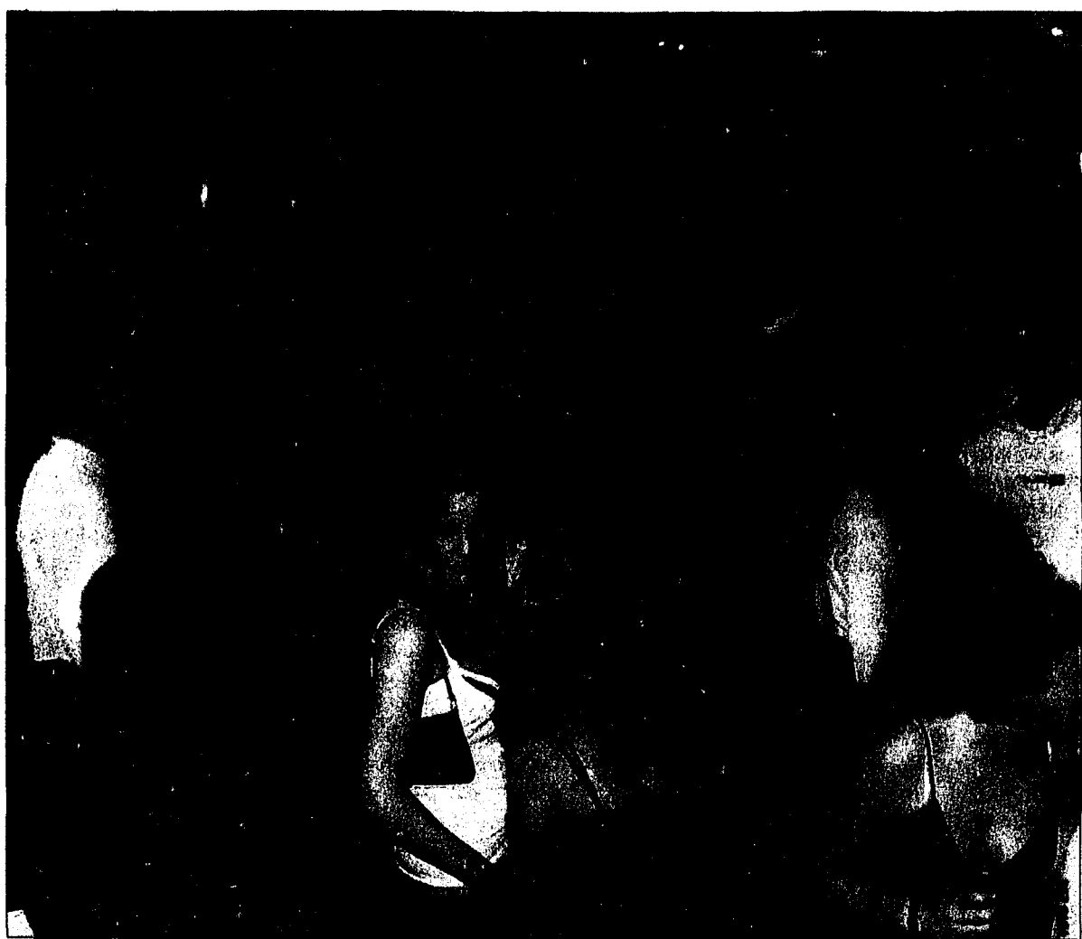
Die «party up! vol. 1» am kommenden Samstag wird allen Besucherinnen und Besuchern noch lange in bester Erinnerung bleiben.

Da tanzen und sich unterhalten bekanntlich nicht nur Spass sondern auch durstig macht, gibt es drei hammer Bars. Jeder Gast kommt dabei sicher auf seine Kosten: An der Bierbar erwartet euch eine grosse Auswahl an verschiedenen Biersorten aus der ganzen Welt. Auch der kleine Hunger kann dort gestillt werden. An der Main Bar werden alle bekannten Longdrinks, Shots