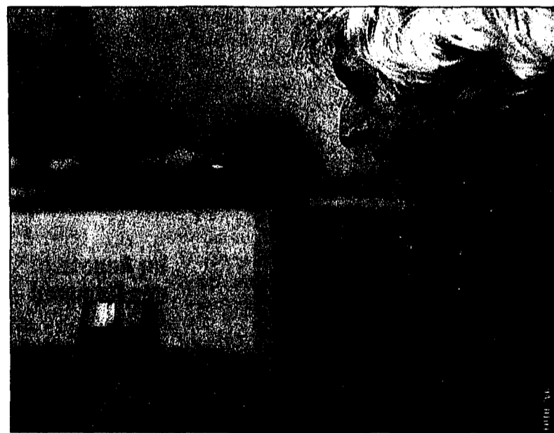
Der 9. Schweizerische Solidaritätstag für Menschen mit Alkoholproblemen dient dazu, die breite Öffentlichkeit für das Thema zu sensibilisieren.

Grosse Mengen Alkohol beeinträchtigen die Gesundheit alter