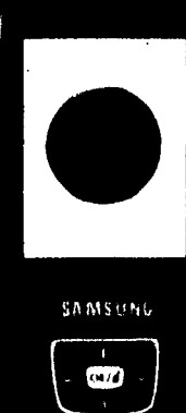
Samsung D 600