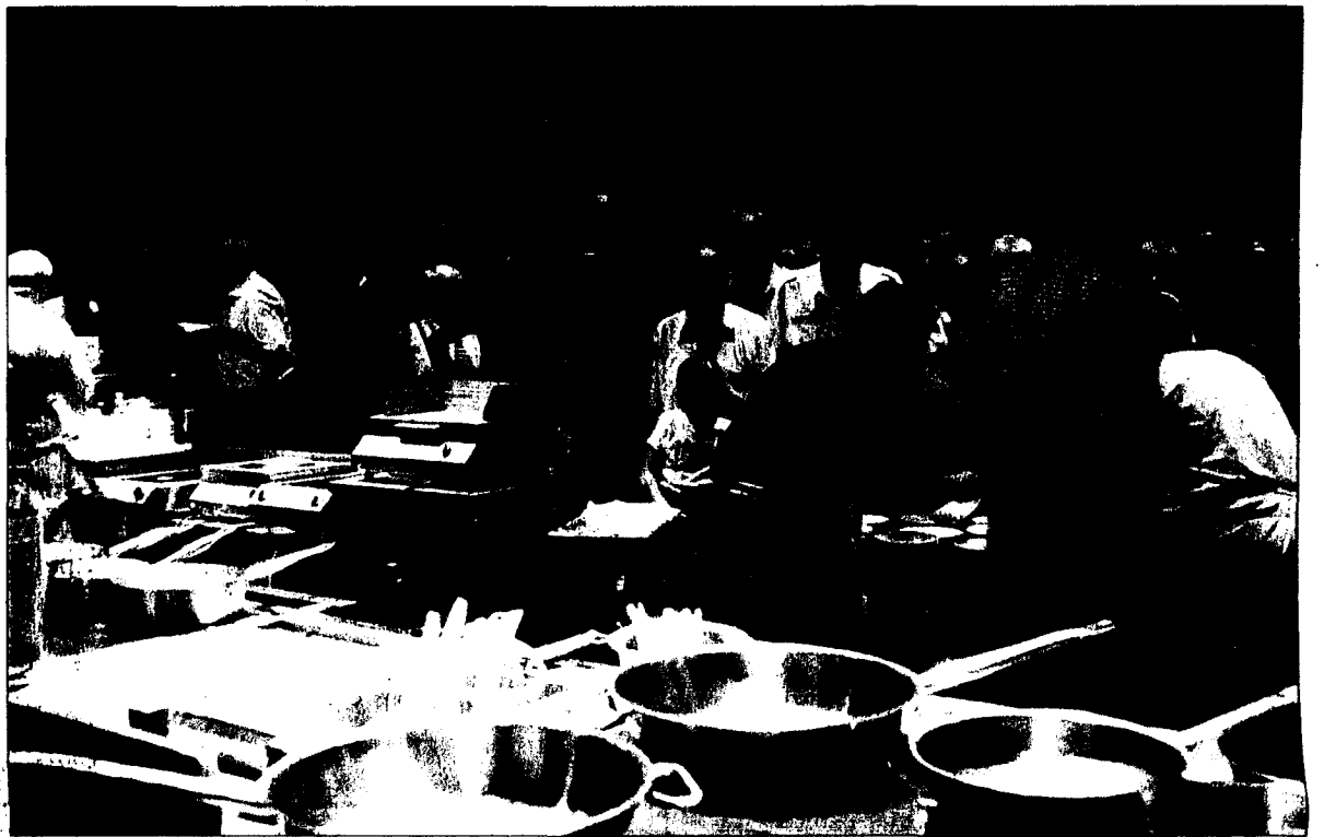
In der Schauküche der «Genuss am See» verraten Küchenmeister Tipps und Tricks.

Für Feinschmecker bietet die «Genuss am See 2005» nicht nur Degustationshäppchen, sondern auch Möglichkeiten zum Genusslichen Verweilen. Die BÖG, Beste Österreichische Gastlichkeit, präsentiert in ihrem Genuss-Restaurant die besten Vorarlberger Köche, der Gourmet Club Vorarlberg zeichnet als Mitveranstalter für den Galaabend am 17.10. verantwortlich. Der junge Wiener Senkrechstarter Oliver Scheiblauber wird das sechsgängige Gala-Menü zaubern. Sein Motto «Dem See auf den