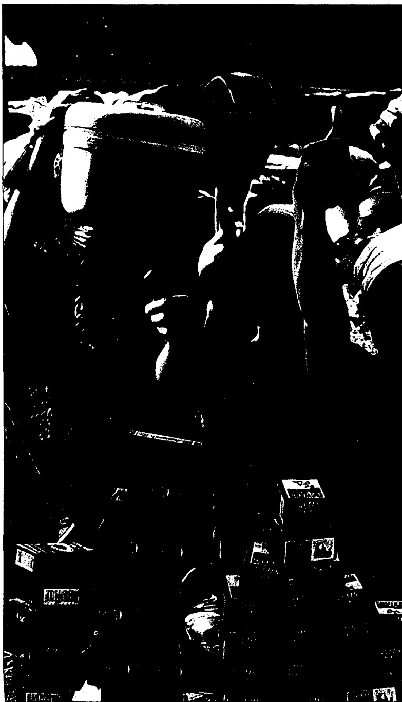
Morgen Sonntag haben Sie im Rahmen des Welternährungstages die Möglichkeit fair zu frühstücken.

Hunger ist kein Schicksal, Hunger wird von Menschen verursacht. Daher kann er auch wirksam bekämpft werden. Es braucht einen Welthandel, der die Länder des Südens gleich stellt. Es braucht landwirtschaftliches Know-how und manchmal braucht es konkrete