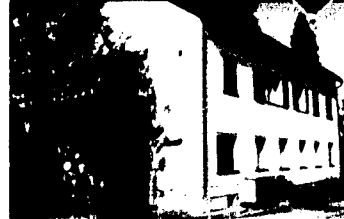
Haus zum Wohnen und Arbeiten

Ein wunderschönes, modernisiertes Haus mit 4 Zimmern und 12 Zimmern, das in einem ruhigen Wohngebiet liegt. Das Haus verfügt über eine offene Wohnküche, ein Wohnzimmer mit Kamin und eine Terrasse. Ideal für Familien mit Kindern.