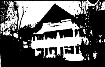
4 12 Zimmer Eigentumswohnung

Ein wunderschönes, modernisiertes Eigentumsapartment mit 4 Zimmern und 12 Zimmern, das in einem ruhigen Wohngebiet liegt. Das Apartment verfügt über eine offene Wohnküche, ein Wohnzimmer mit Kamin und eine Terrasse. Ideal für Familien mit Kindern.