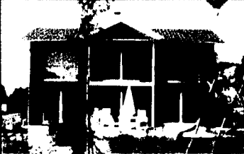
5 12 Zimmer Einfamilienhäuser

Ein herrliches, modernisiertes Einfamilienhaus mit 5 Zimmern und 12 Zimmern, das in einem ruhigen Wohngebiet liegt. Das Haus verfügt über eine offene Wohnküche, ein Wohnzimmer mit Kamin und eine Terrasse. Ideal für Familien mit Kindern.