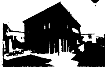
Grosszügiges 6 12 Zimmer Haus

Ein grosszügiges, modernisiertes Haus mit 6 Zimmern und 12 Zimmern, das in einem ruhigen Wohngebiet liegt. Das Haus verfügt über eine offene Wohnküche, ein Wohnzimmer mit Kamin und eine Terrasse. Ideal für Familien mit Kindern.