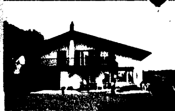
Repräsentatives 8 12 Zimmer-Haus

Ein wunderschönes, modernisiertes Haus mit 8 Zimmern und 12 Zimmern, das in einem ruhigen Wohngebiet liegt. Das Haus verfügt über eine offene Wohnküche, ein Wohnzimmer mit Kamin und eine Terrasse. Ideal für Familien mit Kindern.