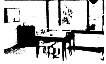
Ruhig gelegene 4 12 Zimmerwohnung

Ein wunderschönes, modernisiertes Apartment mit 4 Zimmern und 12 Zimmern, das in einem ruhigen Wohngebiet liegt. Das Apartment verfügt über eine offene Wohnküche, ein Wohnzimmer mit Kamin und eine Terrasse. Ideal für Familien mit Kindern.