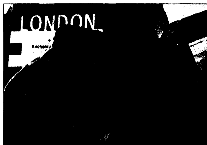
Wenn bei der englischen Sprache manchmal die Wörter fehlen, dem hilft der LanguageMan Plus weiter.

Kaum vorstellbar, der Langenscheidt LanguageMan Plus verfügt über insgesamt knapp 1.5 Millionen Stichwörter, Wendungen, Übersetzungen, linguistische Zusatzangaben und Wortformen. Unter Deutsch-Englisch findet der LanguageMan Plus beispielsweise 46 600 Stichwörter, 23 800 Wendungen und 102 500 Übersetzungen und umgekehrt von Englisch ins Deutsche hat das «Kerlchen» 28 300