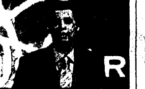
Wer wird Millionär? Zum Start der neuen Staffel feiert Günther Jauch die 500. Ausgabe seiner Erfolgssendung mit einer Doppelpage.