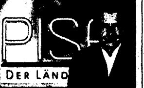
PISA - Der Ländertest Aus welchem Bundesland kommen die Klügsten? Als Titaheroldiger präsentiert sich Baden-Württemberg.