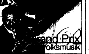
Grand Prix der Volksmusik ... Zum 20. Mal wird der beste Volksmusikant gekürt. Sascha Ruffer und Monika Fasnach führen durchs Programm.