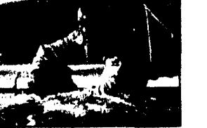
Doppelmord Nick inzeriert seinen Tod. Seine Frau (A. Judd, I) wandert wegen Mordes ins Gefängnis - und stirbt auf Pflanz.

20.15 Die Junior-Millionenshow Auch diese Jahr hat Armin Assinger wieder prillige Kinder in seine Show geladen. 21.05 Die dunkle Gabe Thriller, USA 2000 23.45 Die dunkle Gabe Thriller, USA 2000