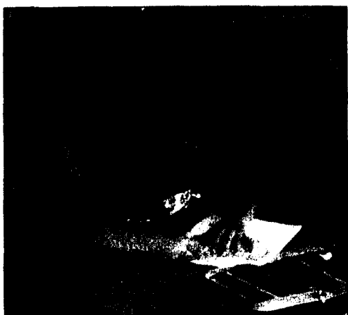
«Ich male sehr gerne aus. Ich mache dann immer alles ganz farbig», erzählt Alper.