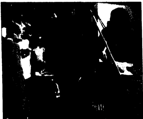
Selbst gebackenes Brot nach Pfadi-Rezept ist bei den Kindern sehr beliebt.