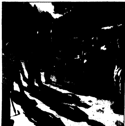
Fachleute machten die Wanderer auf die vielen besonderen Naturschätze entlang der Wegstrecke aufmerksam.