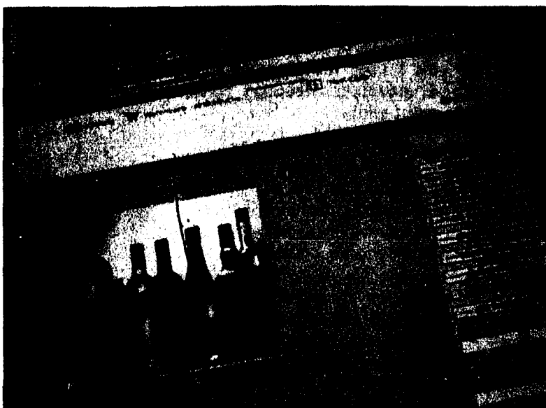
Auf www.getraenkeoase.li lassen sich Getränke ganz einfach online bestellen.

Eine vielschichtige Suchfunktion führt den Shop-User schnell und unkompliziert zu den gewünschten Artikeln. Getränkearten, Länder