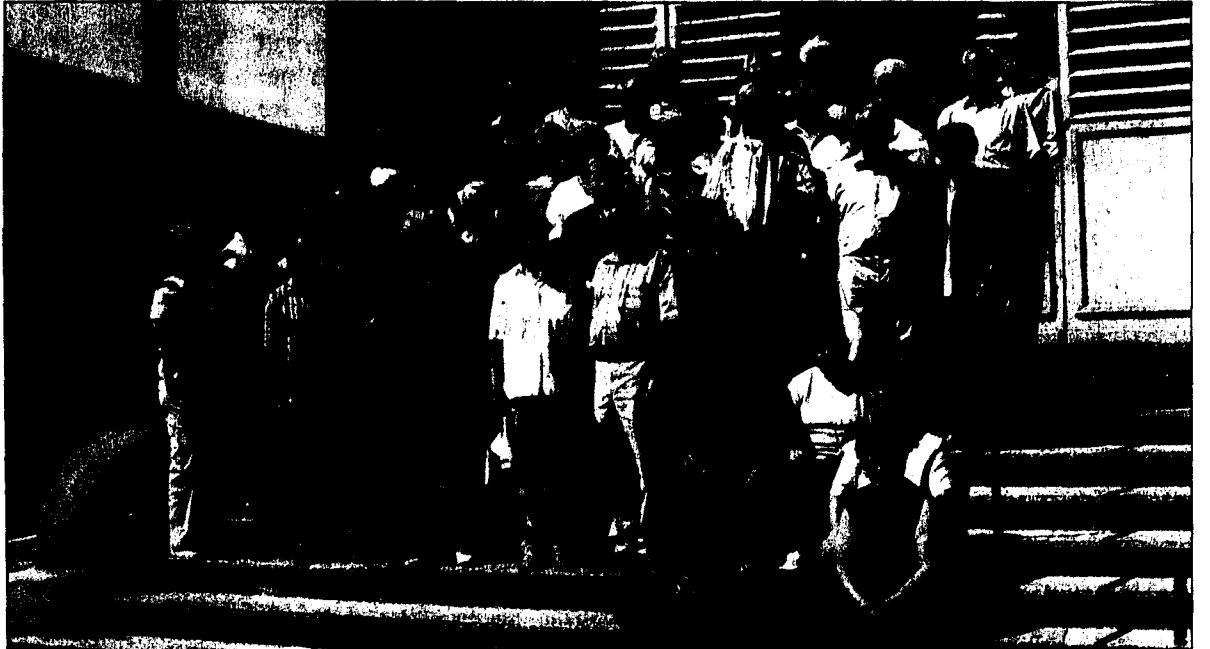
Zwischen Liechtenstein und Brüssel: In Metz, auf dem schönen Platz bei der Kathedrale, posierten sich die Reiseteilnehmer zum Erinnerungs-Gruppenfoto.