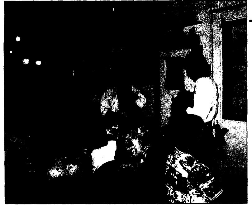
Stimmungsvoller Abschlussabend in einem typischen Brüsseler Restaurant mit original belgischer Musik und üppigem Schlemmermentü.