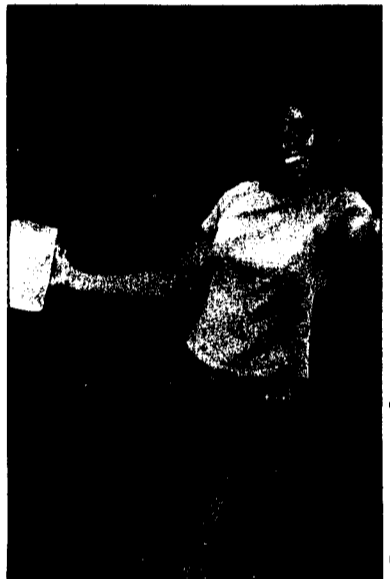
Michaela macht eine gute Figur beim Hindernislauf der Pfadfinder.