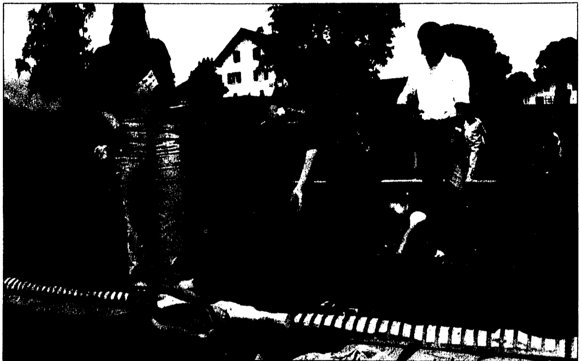
In die Kanne treffen: Ballspiele sind bei den Kindern immer sehr beliebt.

Auf dem abwechslungsreichen Programm standen eine Vielzahl von lustigen Geschicklichkeitsspielen, die zum Mitmachen animierten und den Zuschauern sowie Aktiven viel Spass boten. Einige Impressionen. (Red.)