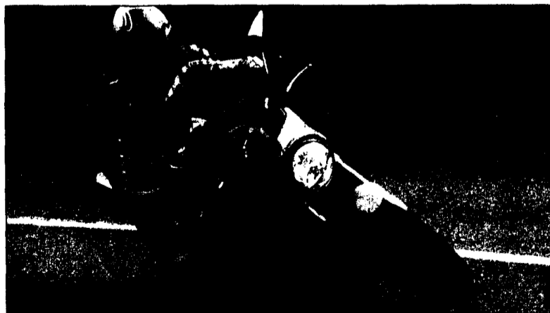
Neben dem schattigen Design wartet die Honda CB600F Hornet mit einigen technischen Neuerungen auf.

Wer sich dazu entschliesst, die Zukunft gemeinsam mit der CB600F Hornet zu verbringen, wird bestimmt nicht enttäuscht. Die Hornet ist ein Alleskönner; schnittig designt, dennoch nüchtern funktional, fehlerverzeihend, zuverlässig, rassistig. Egal ob im Stadtverkehr, auf der Autobahn, kurvigen Überland- oder Passstrassen, mit der 600er-Hornet (ab 11 500 Franken) ist man bestens bedient. Und ein hoher Spassfaktor ist dabei garantiert. Seit Jahren schon prägt Honda mit seiner kleinen Hornisse die Mittelklasse der Naked Bikes, und auch das neueste Modell wartet wieder mit einigen interessantesten Neuerungen auf. Die auffälligsten Änderungen