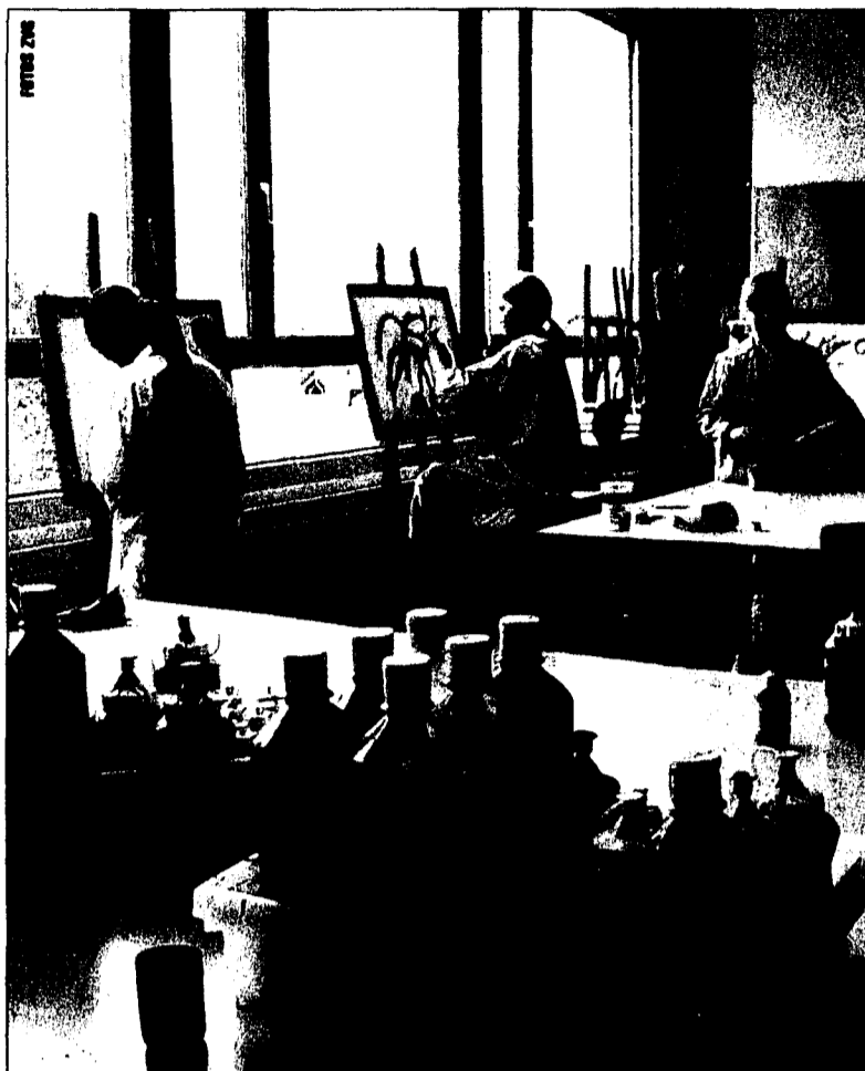
An der Kunstschule Liechtenstein beginnen wieder Kreativkurse für Kinder, Jugendliche, Erwachsene und Senioren – aufgrund der Nachfrage werden nun Kurse doppelt geführt und es sind noch einige Plätze frei. Auch ein Aktzeichnen-Kurs (rechtes Bild) ist wieder im Kursangebot.

Kursbeginn an der Kunstschule Liechtenstein – Grosses Angebot an Kreativkursen