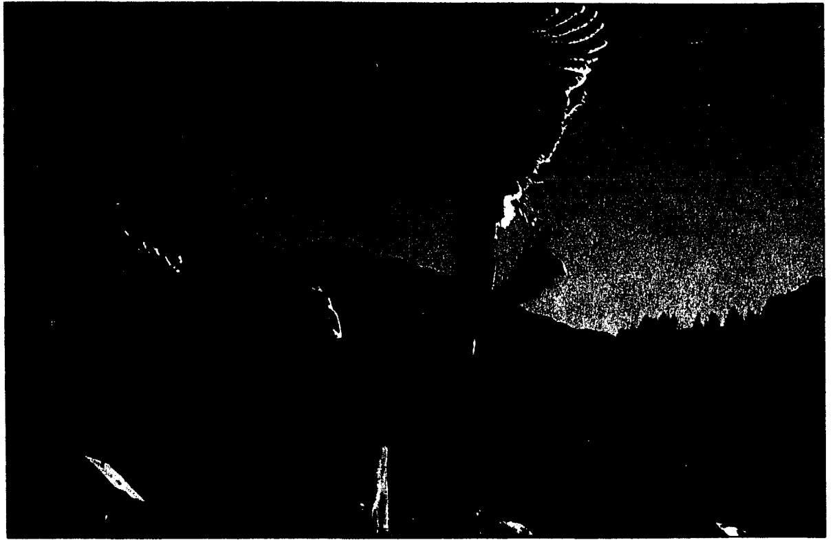
Die Greifvogelstehschau der Falknerei Galles in Malbun ist eine der im Erlebnispass inbegriffenen Aktionen.

Noch bis 21. Oktober sparen die Nutzer des «Erlebnispasses Liechtenstein» bares Geld. Statt 125 Franken an Einzeleintritten zu bezahlen, sind mit dem Pass alle enthaltenen 25 Attraktionen für nur 19 Franken zu geniessen. Mit 25 Attraktionen verspricht der Erlebnispass Liechtenstein gute Laune. Lebenslust mit Kultur, sportliche Action, Abenteuer auf Berggipfeln, Kinderträume, Geschichte und Geschichten inklusive. Der Pass spart bares Feriengeld und die Umwelt. Denn mit dem Erlebnispass sind Tickets auch für die Busse quer durchs Land und die Bergbahnen im Ferienparadies Malbun frei. Beliebt ist der Pass auch als Geschenk an Freunde und Bekannte aus dem In- und Ausland sowie für