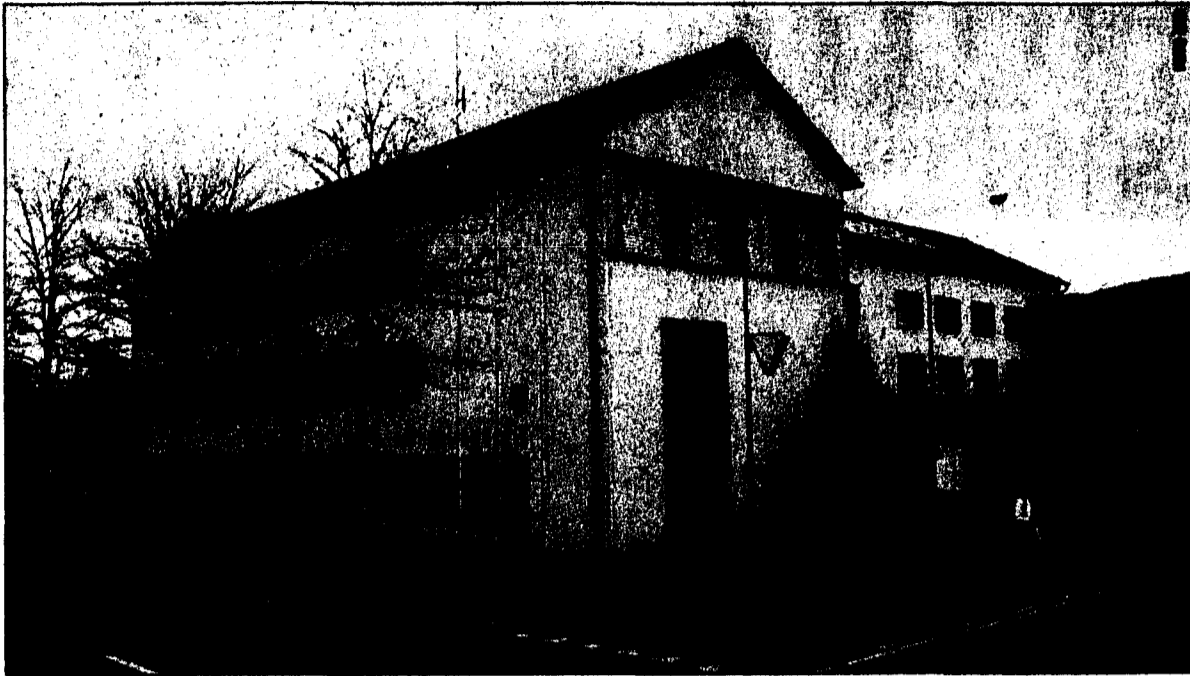
Mehr Steuereinnahmen: Die Gemeinde Ruggell verzeichnete in der Jahresrechnung 2004 (Laufenden Rechnung) ein Plus von knapp 4,6 Millionen Franken.

In der Laufenden Rechnung steht einem Aufwand von 7,1 Mio. Franken ein Ertrag in Höhe von 11,7