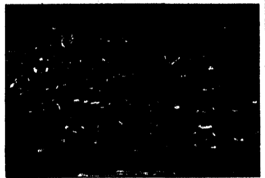
Die Atemschutzträger und ihre Helfer.

SCHAAN/BUCHS - Unter der Federführung der Feuerwehr Schaan wurde am vergangenen Samstag eine Atemschutzgrosseübung mit 50 Teilnehmern durchgeführt. An der Übung, welche im Brandhaus der Feuerwehr Buchs abgehalten wurde, waren die Atemschutzabteilungen aus Triesen, Planken und dem vorarlbergischen Dünserberg beteiligt. Unter realistischen, heissen Bedingungen, wurden Lösch- und Rettungseinsätze in gemischten Formationen geübt. Die Feuerwehr Schaan bedankt sich bei allen Beteiligten für das gute Gelingen. (PD)