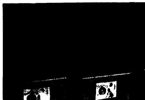
Nahna denkt interessiert mit.