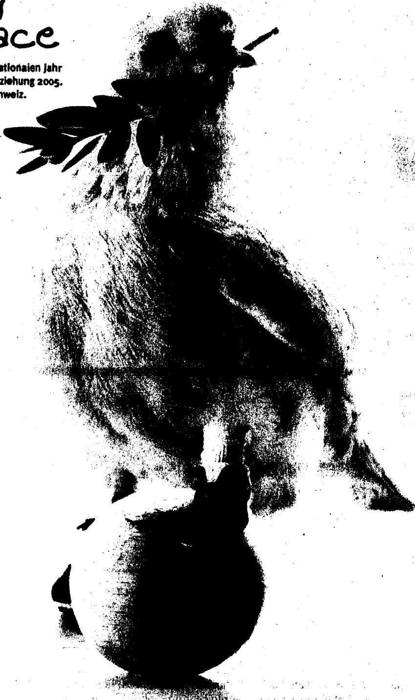
Das Erscheinen dieses Inserates wurde gesponsert.