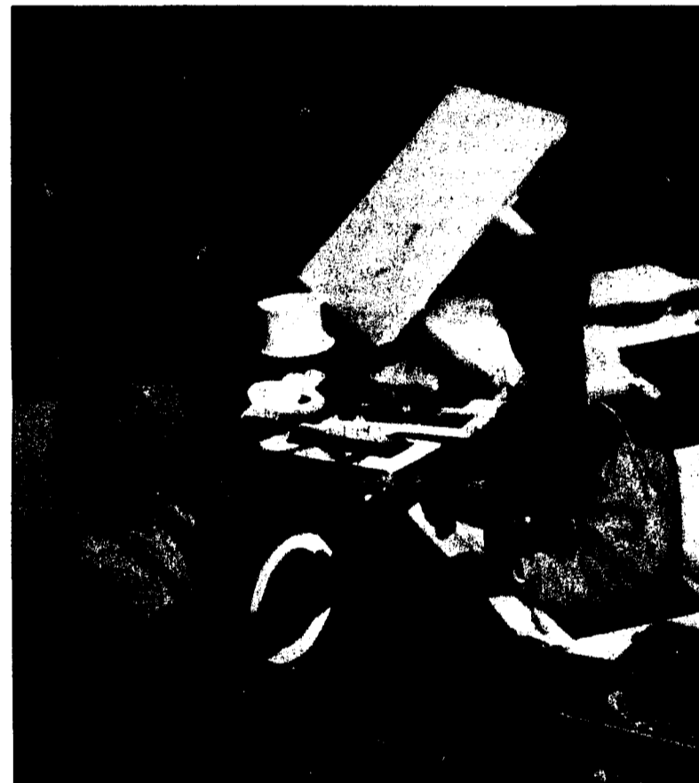
Letzte Handgriffe vor der Inbetriebnahme.

zu beraten hat – von der Planung und Projektierung, dem Schwimmbadbau, den Belägen, der Umgebungsgestaltung, bis hin zum Garten, alles vom Gartenbauspezialisten. (MG)