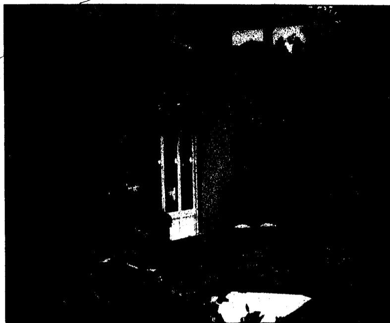
Harmonisches Zusammenspiel von Pool und Gebäude.

Geniessen und ausspannen am eigenen Pool