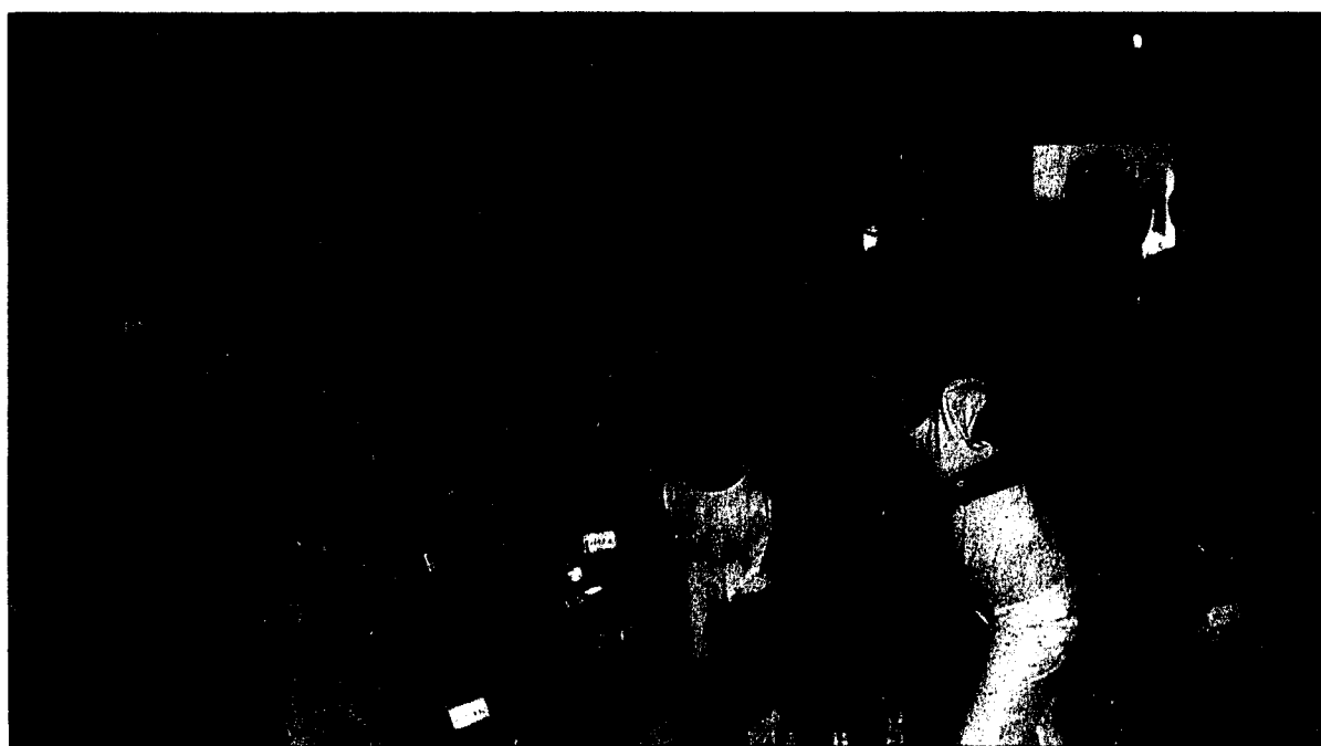
Bereits der Kindersommer 2004 im liechtensteinischen Landesmuseum war ein grosser Erfolg.

Das Museumsabenteuer «Von Fröschen und Prinzessinnen» findet am Montag, 8. August 2005, von 14 bis 17 Uhr statt und besteht aus drei Teilen. Begonnen wird mit der Vorführung eines kurzen Theaterstücks, mit dem die Kinder in das Thema eingeführt werden. Im Anschluss daran erfahren die Kinder in einer interaktiven Führung im Ausstellungsbereich «nutzen» viel über die