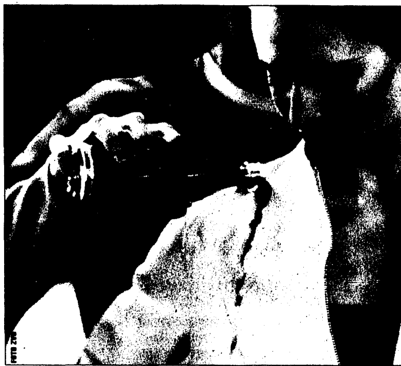
Mit Nanotechnologie wasser- und schmutzabweisend.