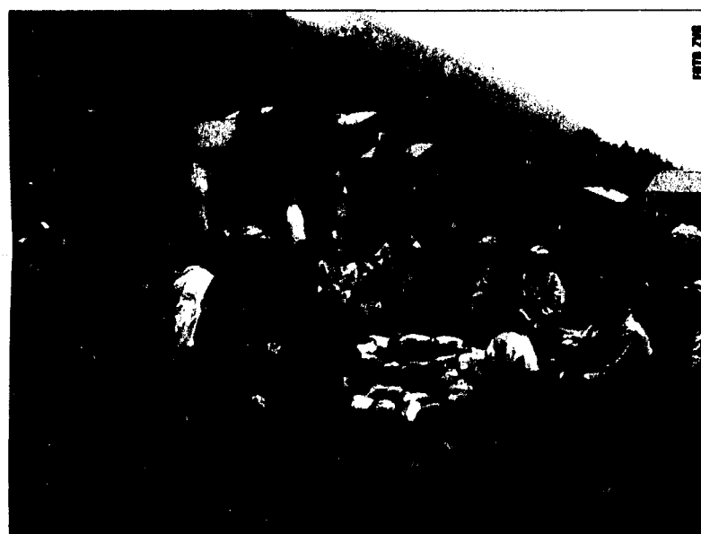
Mit der Initiative «fam – mehr familie mehr urlaub» rücken die Schwärzler-Hotels die Bedürfnisse von Familien in den Mittelpunkt ihrer Ferienaktivitäten.

Viel Platz wird in den «fam-hotels» auch gemeinsamen Familien-Erlebnissen eingeräumt. Die Angebote sind sehr ideenreich und vielfältig. «Im hektischen Alltag haben Familien oft nur wenig Zeit für gemeinsame Erlebnisse. In den «fam-hotels» bieten wir zahlreiche Möglichkeiten, um Familienbande zu intensivieren und Eltern-Kind-Beziehungen zu festigen. Zudem wird der Kontakt zu anderen Familien geför-