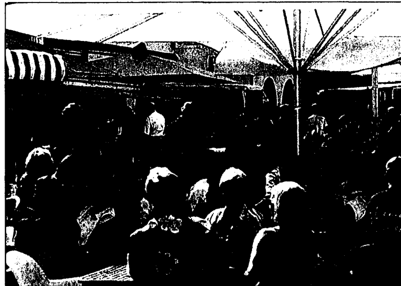
Die Gemütlichkeit kommt mit Bestimmtheit nicht zu kurz.

Alles Käse? Alles Käse heisst es beim Stand der «KäseStrasse» Bregenzerwald. Die Gastregion wird neben kulinarischen Schmankerl auch für die musikalische Untermalung sorgen.