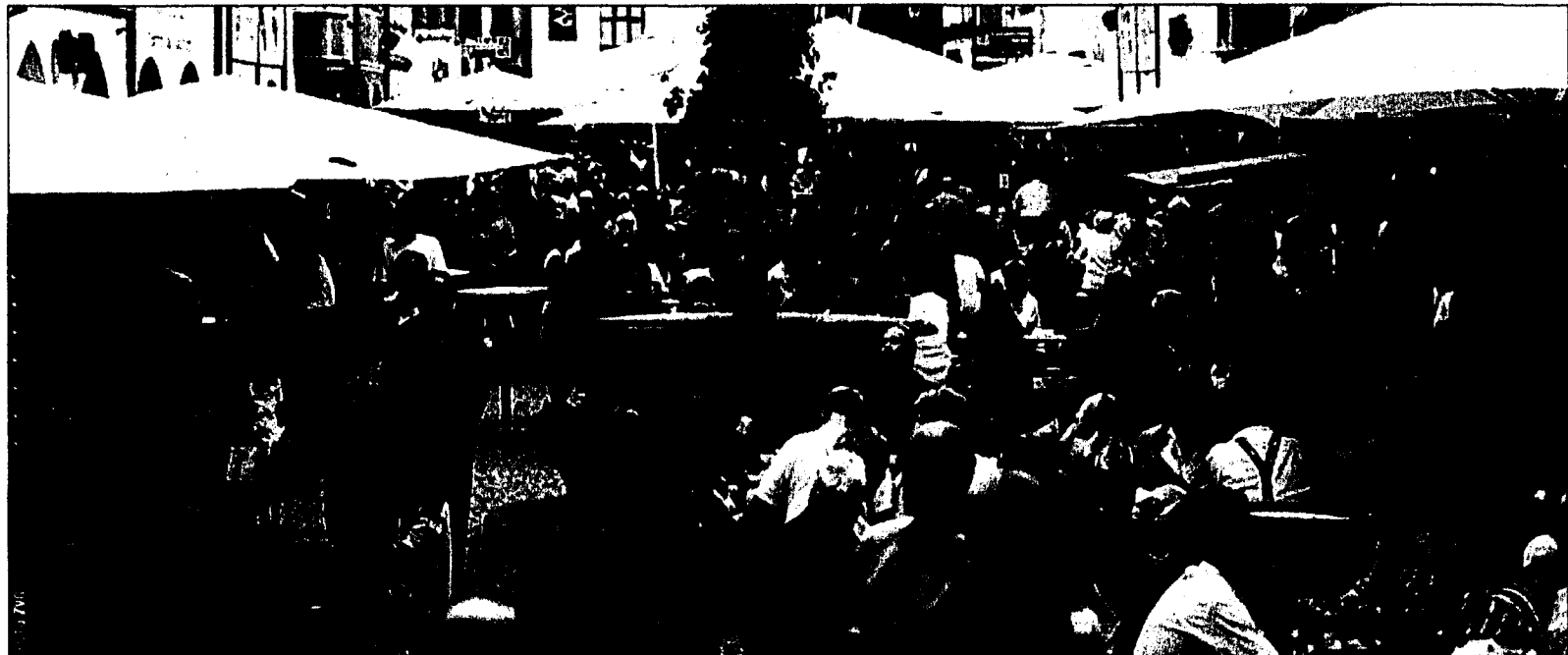
Von Freitag bis Sonntag stakt Feldkirch ganz im Zeichen des Weines. Zahlreiche Attraktionen warten auf die Besucherinnen und Besucher.

FELDKIRCH - Vom 8. bis 10. Juli ist Feldkirch das sommerliche Weinmekke in Österreichs Westen. Weinfreunde aus der Region und aus dem angrenzenden Ausland geniessen das traditionelle Feldkircher Weinfest vor der wunderschönen Kulisse der mittelalterlichen Markt-gasse.