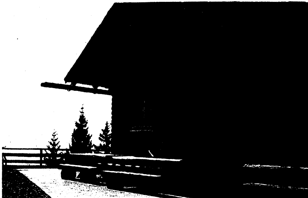
Die Hütte Gafadura ist ein beliebtes Reiseziel für Wanderer wie auch Mountainbiker.

Eine der schönsten Wanderrouten in Liechtenstein ist der Fürstin-Gina-Weg. Dabei ist die Pfälzerhütte Dreh- und Angelpunkt des Wegs, in der man bei rund 5-stündigen Wanderzeit gerne eine Pause einlegt, um sich für den weiteren Verlauf zu stärken. Wer die Route inklusive einer Übernachtung bewältigen will, findet in der Herberge Platz.