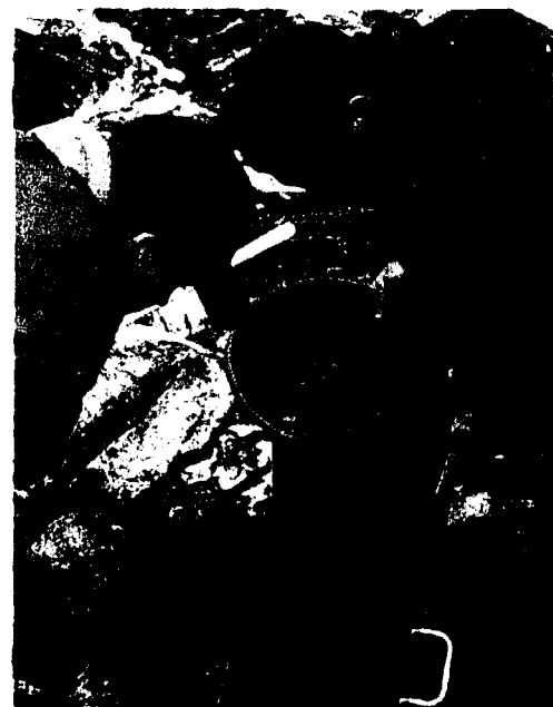
Für die Abenteuerlustigen stehen professionelle Goldsuchergeräte bereit.

Ein Abenteuer der besonderen Sorte bietet auch der Goldtaucherkurs. Oftmals verstecken sich schöne Nuggets in Naturpools, unterhalb von Wasserfällen, wo man nur noch mit Tauchen die Chance hat sie zu finden. Diese Kurse dauern ebenfalls zwei Tage und werden für Teilnehmer durchgeführt die mindestens über das Brevet 1 sowie eine eigene Tauchausrüstung verfügen. Auch hier muss die Ausrüstung teilweise im unwegsamen Gelände mit Seilbahnen in die Schlucht transportiert werden. Campiert wird in der Wildnis. Ein Abenteuer also für «harte Kerle», die einmal einen besonderen Tauchgang erleben wollen. (gr)