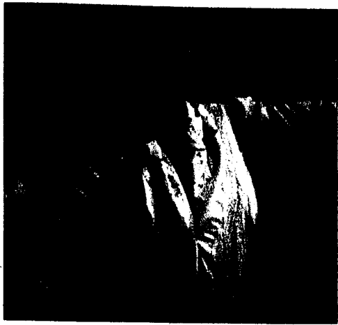
Noche de Flamenco: Samstag 2. Juli, in Eschen.