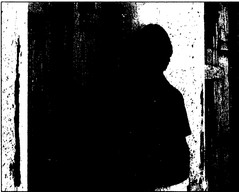
Der erste Grammy-Gewinner für klassische Gitarre solo: David Russell spielt am Dienstag, den 5. Juli 2005, im Gemeindezentrum von Eschen.

Weltklasse an den 13. Liechtensteiner Gitarrentagen (Ligita)