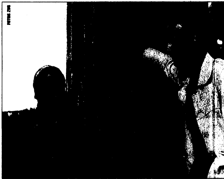
Jazz an den 13. Ligita: Wolfgang Muthspiel (rechts) solo und mit seinem Trio am Donnerstag, den 7. Juli 2005, im Gemeindezentrum von Eschen.

ESCHEN - Die Topstars der internationalen Gitarrenszenen geben sich im Liechtensteiner Unterland während einer Woche die Ehre. Die musikalischen Höhepunkte reißen sich aneinander: Der dieses Jahr mit einem Grammy ausgezeichnete David Russell oder die «Noche de Flamenco» mit Gerardo Nuñez sind nur exemplarisch genannt.