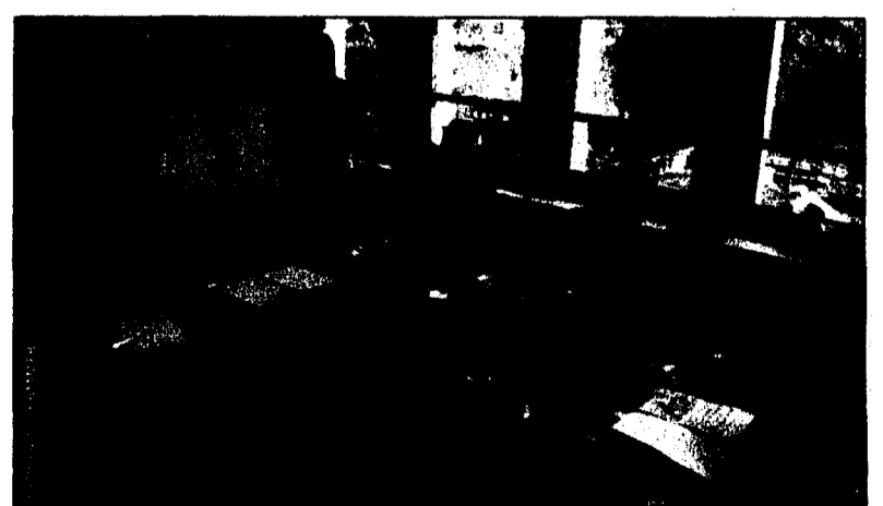
Bettina O. Stöckli vermittelt verschiedene Lernstrategien an Kinder und Jugendliche.