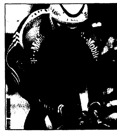
Zeitfahren-Sieger: Jan Ullrich.

Ullrich liess das australische Duo Bradley McGee um 15 und den zweifachen Weltmeister Michael Roger um 18 Sekunden hinter sich. Fabian Cancellara auf Platz 4 lag schon 39 Sekunden zurück. Der Berner zeigte sich nicht unzufrieden: «Es ist besser gegangen als erwartet. Bisher hatte ich in dieser Saison nur zwei kurze Zeitfahren hinter mir. Dies war eine gute Standortbestimmung über eine grössere Distanz.» Cancellaras Genugtuung rührte vor allem daher, dass er am Schluss nicht eingebrochen war. Der 24-Jährige versprach: «In dieser Rundfahrt will ich noch etwas zeigen.»