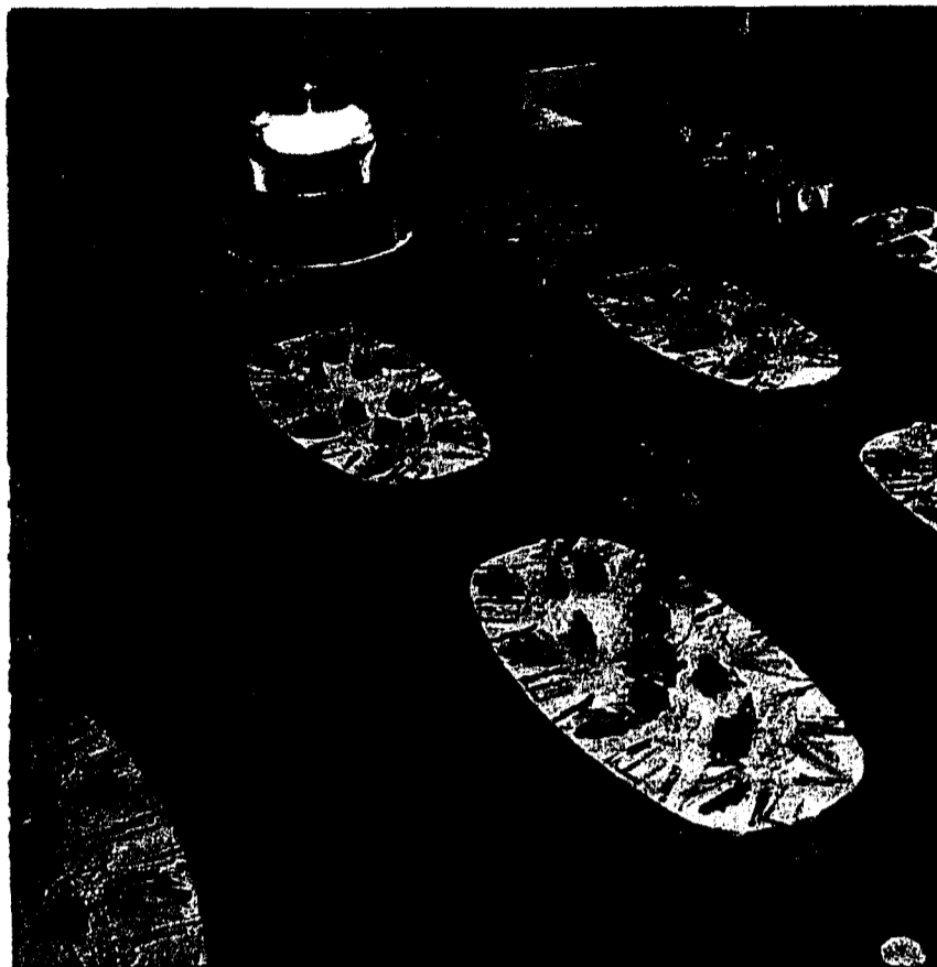
Gedeckt für eine Hochzeit: Schön hell und in freundlichen Farben zeigt sich der Saal von innen. Er bietet Platz für bis zu 140 Personen.

förmlich zum Verweilen ein. Naturtöne auch bei den Vorhängen und den Kissen. Alles in Gelb, Orange und Rot. Richtig heimelig. Trotzdem wirkt es nicht wie eine typische Landstilenrichtung. Zwar traditionell, jedoch mit der richtigen Prise an Moderne. Der Saal hat acht elektrische Dachfenster, die für genügend Lichteinfall und Lüftung sorgen. Aber nicht nur Dachfenster, auch normale Fenster ringsherum lassen das Tageslicht in den Raum. In der