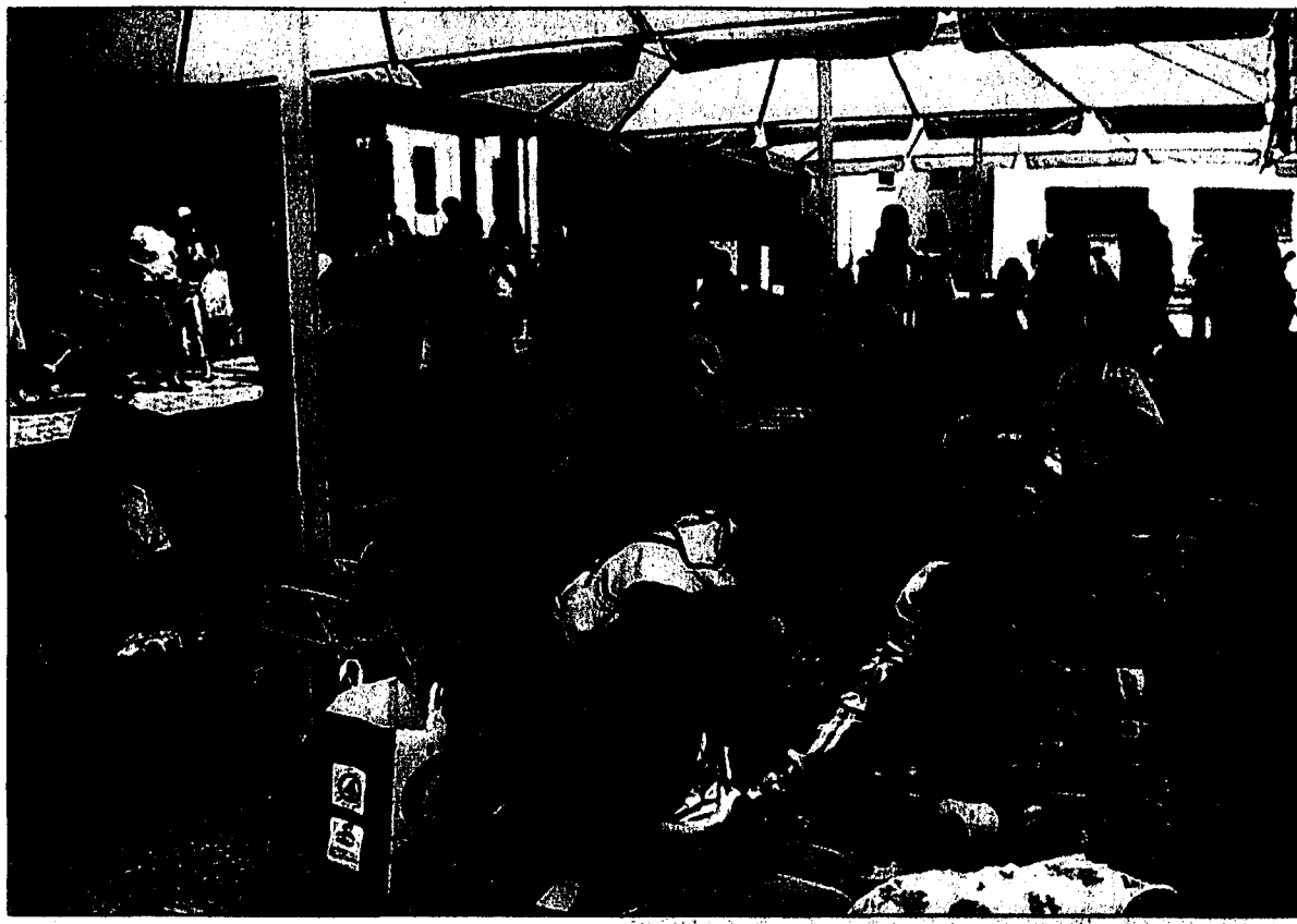
Zum zweiten Mal fand der Kinderflohmarkt in Eschen auf dem neu gestalteten Dorfplatz statt.