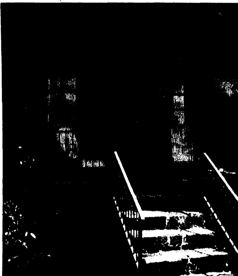
Ambiente durch Verwendung natürlicher Materialien