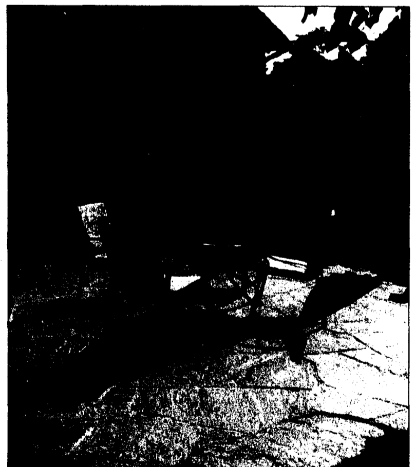
Pro Natura AG schafft Oasen in jeder Form