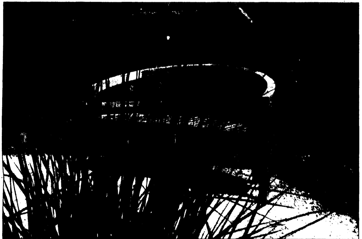
Unverzichtbar – die Gartenbank für den lauschigen Ort