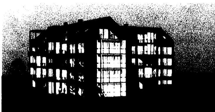
Projektierte 4 1/2- und 5 1/2-Zimmer-Wohnungen an der Churer Strasse in Buchs: Wohnfläche von 154 m 2 , rollstuhlgängig, Lift, Minerglestandard ab 540 000 Franken inkl. Garagenplatz und Keller. Ausbauwünsche werden berücksichtigt.