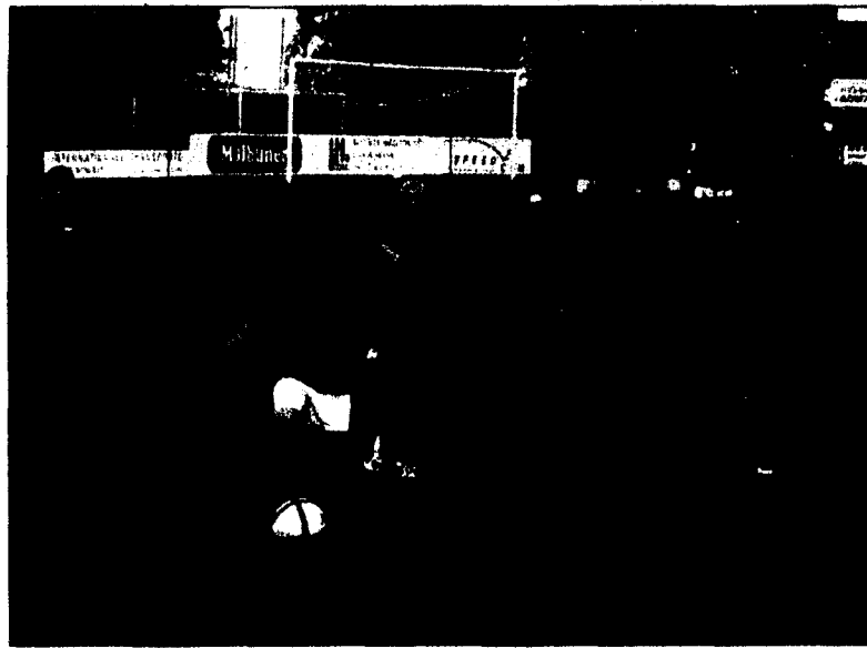
Beim traditionellen LKW-Schülerturnier waren 21 Mannschaften am Start.

Das traditionelle LKW-Schülerturnier des FC Ruggell war einmal mehr ein voller Erfolg. Mit 21 Teams aus Liechtenstein und dem benachbarten Ausland (Schweiz) tummelten sich rund 200 Schüler auf der Sportanlage Widau in Ruggell. Sportlich schenkten sich die Teams nichts. Dennoch waren schon nach wenigen Partien die ersten Favoriten auf den Gesamtsieg auszumachen. Die Niveauunterschiede der einzelnen Teams war teilweise sehr gross, doch dies tat