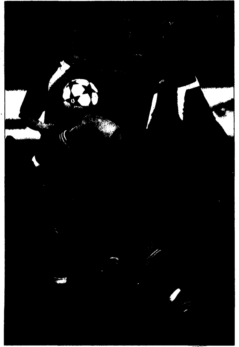
Der FC Triesenberg stoppte die Schaaner im Aufstiegsrennen.